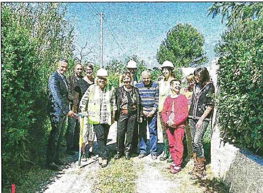
Une partie des riverains, heureux, aux côtés des élus et représentants de la SPL L'eau des collines qui conduit le chantier de raccordement.

"Nous nous sommes engagés à relier tous les quartiers d'ici la fin du mandat..."